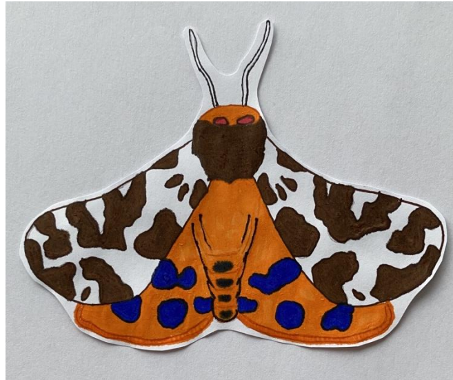
Abbildung 2: Brauner Bär farbig, eigene Abbildung

2.) Ausmalbild. Der Braune Bär ist ein wunderschöner Schmetterling. Male den Braunen Bären möglichst naturgetreu aus: