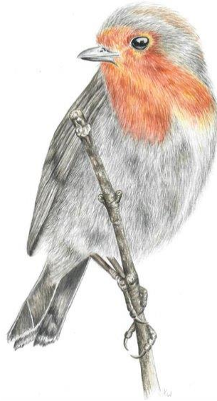
Das Rotkehlchen (eigene Darstellung, 2021)

Das Rotkehlchen ist einer der bekanntesten und beliebtesten Vögel in Deutschland. Ein Grund dafür ist, dass es ganzjährig beobachtbar und durch seine orangene-rote Brust leicht zu erkennen ist. Die großen runden schwarzen Augen sind ein zusätzliches Erkennungsmerkmal. Diese ermöglichen dem Rotkehlchen auch während der Dämmerstunden, also vor und nach Sonnenaufgang, ein gutes Sehen zur Beutejagd. Ein weiterer Grund ist Robins zutrauliche Art und niedliches Aussehen . Dies veranlasste die Bürger*innen dazu, Robin als Vogel des Jahres 2021 zu wählen.